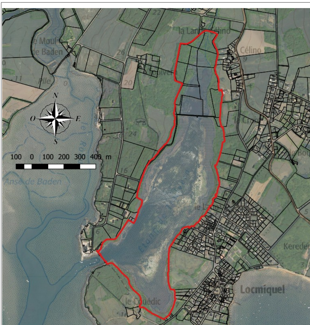
Périmètre inscrit en arrêté de protection de biotope