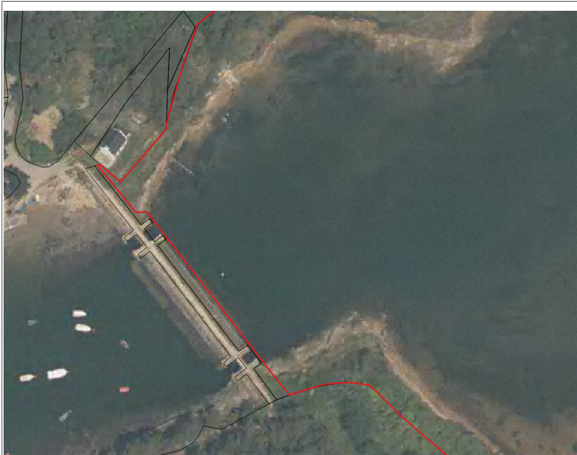
Zoom sur la limite sud de l'arrêté au niveau de la digue